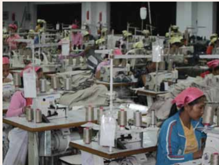
...trabalhadores têm jornadas muito maiores do que no Brasil

A concorrência acirrada não é novidade. Da mesma forma, a invasão de importados também não surpreende mais. O que estremece é a velocidade com que essas importações aumentam por meses seguidos. Para que se tenha uma idéia clara dessa tendência avassaladora, enquanto no mês de janeiro de 2010 as importações de vestuário eram de US$ 79 milhões, neste mesmo período de 2011, as compras do exterior, neste item, foram de US$ 131 milhões. Isto é, houve uma alta de 66%, apenas em um ano, segundo dados do MDIC.