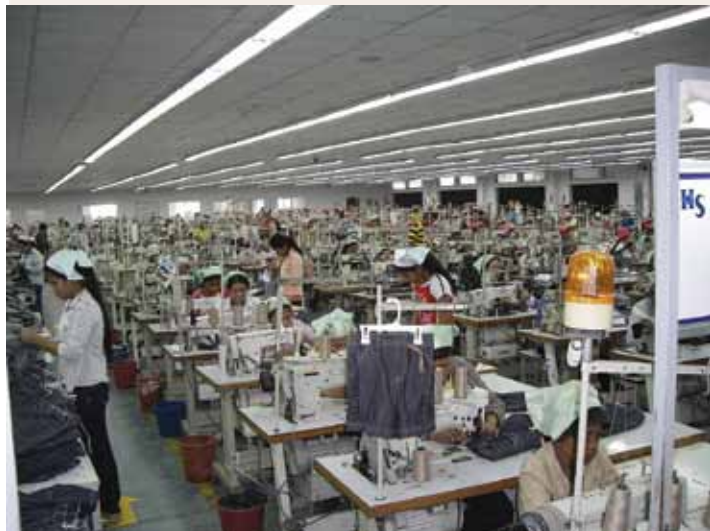
Fábricas asiáticas, nas quais...