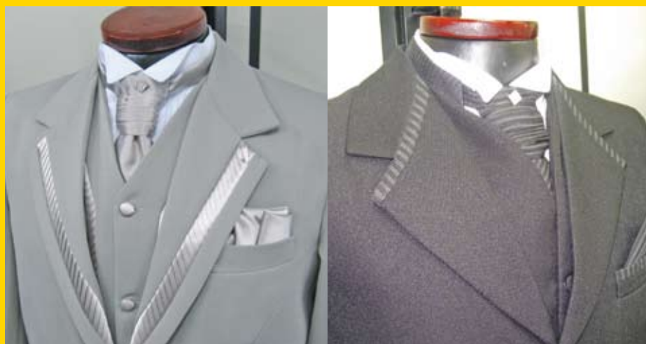
Modelos da coleção da Via Santony

contratar mais trabalhadores, não na redução da jornada. A medida vai gerar um aumento nos preços dos produtos. Temo pela perda de vendas e, assim, enfrentarmos mais dificuldades”, critica o empresário.