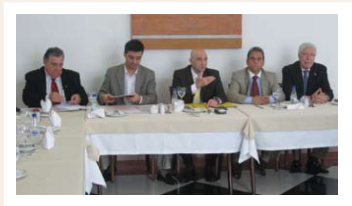
Representantes do setor em coletiva com a imprensa local

“O mercado exige ações cada vez mais rápidas, pontuais e precisas dos empresários. E para isso ter informações corretas de forma ágil é fundamental. O CIVETEX se propõe à missão de preencher a atual lacuna, com critérios e fundamentos do cenário macro, mas com o olhar e o conhecimento diferenciados, próprios de quem vive o dia-