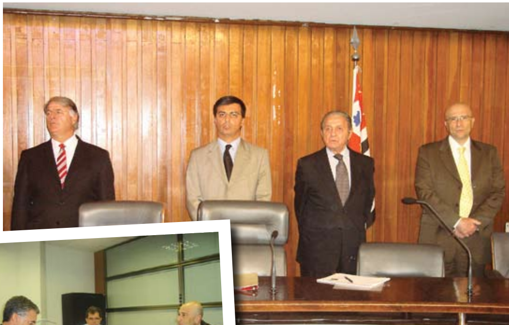
Empresários durante visita à Frente Parlamentar